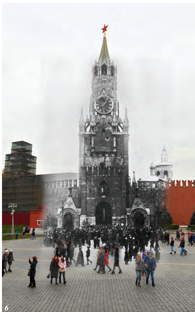
Спасская, она же Фроловская, башня (фото 6)

Пробитая снарядами Спасская башня. Один из них попал прямо в куранты, видна дыра на месте цифры XII. Снаряд в куранты попал из гаубиц, стоящих на Швивой горке, у церкви Никиты в Заяузье.