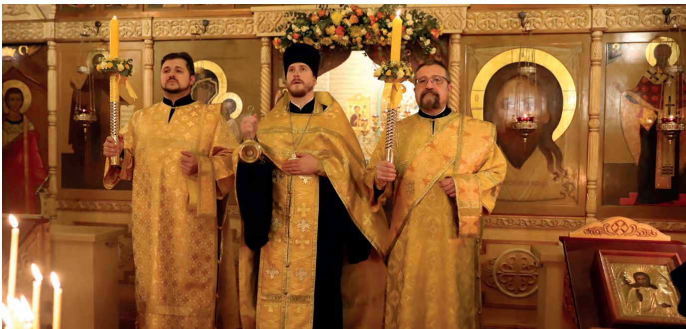
Престольный праздник в храме свт. Николая у Соломенной сторожки (2021 г.)

который говорил, что, когда вы станете священниками, когда к вам придут люди с каким-то вопросом, никогда не стесняйтесь сказать: «Я не знаю». Этой фразы не надо бояться. Нужно отвечать искренне, если вы не знаете. Как священник вы можете предложить помолиться за человека, помянуть его на проскомидии. Если нет никакого решения, то можно сказать так: «Давай будем молиться – и ты, и я. Возможно, Господь что-то откроет, подскажет». Лучше не дотянуть до своей меры, чем ее превысить. Вот такой смысл. Каждый совет – это же ответственность.