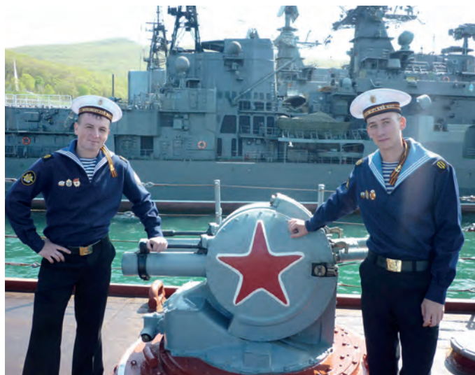
Служба на военно-морском флоте (Владивосток, 2010 г.)

– У меня был там такой сильный голод по духовной жизни. На корабле были книги, которые мне из дома прислали. Я читал Евангелие, Псалтирь, каноны, читал святых отцов с большим желанием и интересом. На корабле был небольшой храм в честь Покрова Божьей Матери. Буквально одна каюта, переделанная под храм, с иконостасом, с престолом. Еще мы смотрели военные патриотические фильмы, были запоминающиеся встречи с нашим заместителем командира по воспитательной работе. Я его вспоминаю тоже с большой любовью. Он с такой искренней любовью к России рассказывал о военных походах, о полководцах, о разных случаях, воспитывал в нас здоровое чувство гордости за