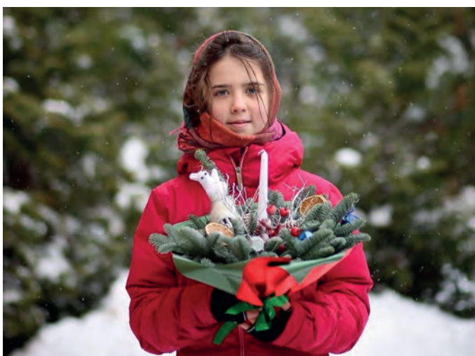
Рождественское настроение для вас!