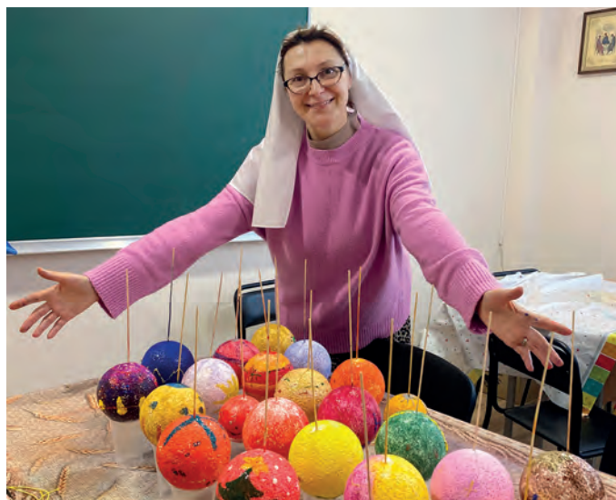
Дерево и учитель познаются по плодам