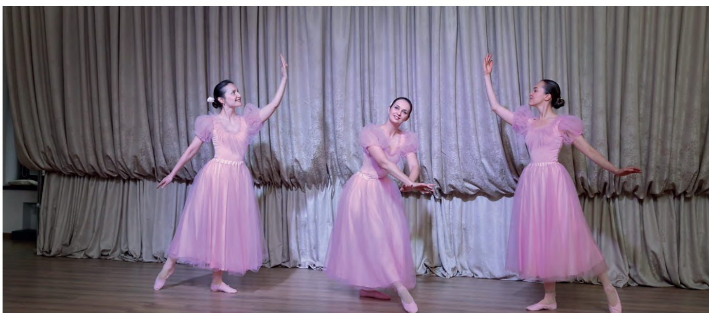
Танец «Музыкальная шкатулка»