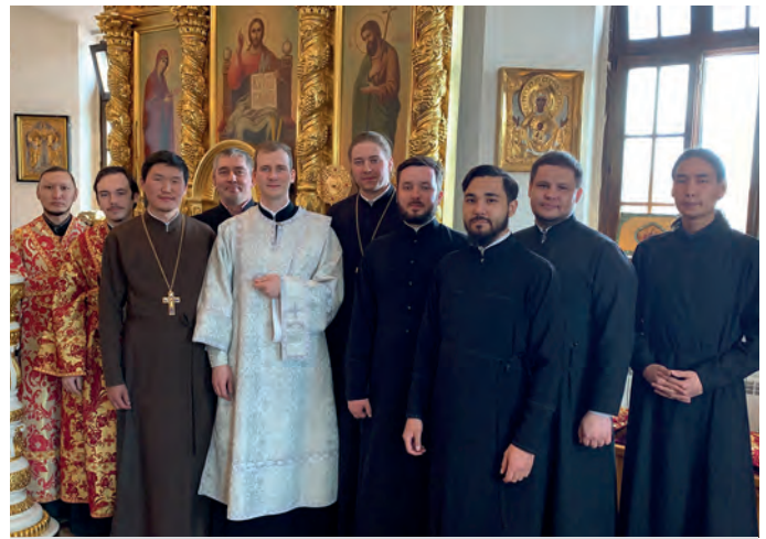
В день рукоположения во диакона (Якутск, 2021 г.)

завет, Новый завет, несколько других дисциплин. Студенты мне очень понравились, хорошие ребята, которые с интересом слушали и учились.