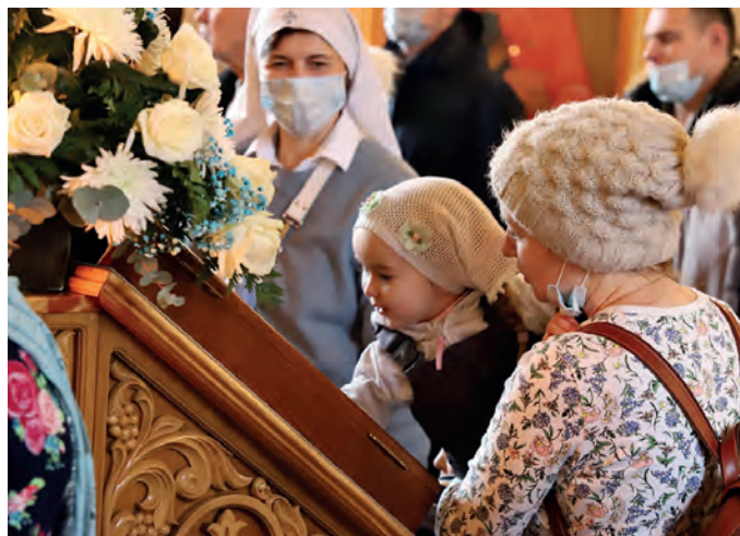
Детство – лучшая пора для встречи с Богом