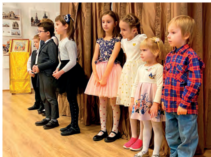
Признаемся мамам в любви