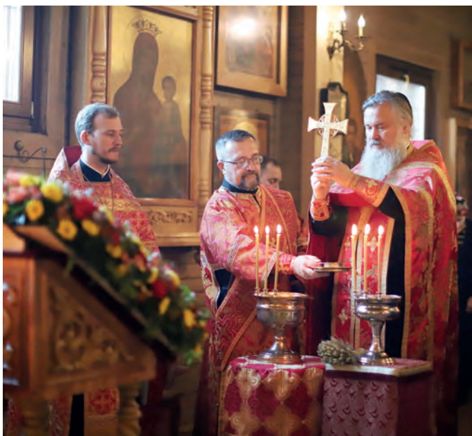
Крестом Твоим, Господи, хвалимся!