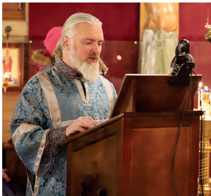
Легко молиться под чтение наших алтарников!