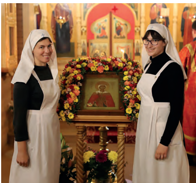
Эти милые лица!