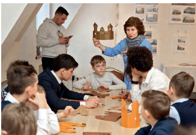
Груда книг не заменит хорошего учителя