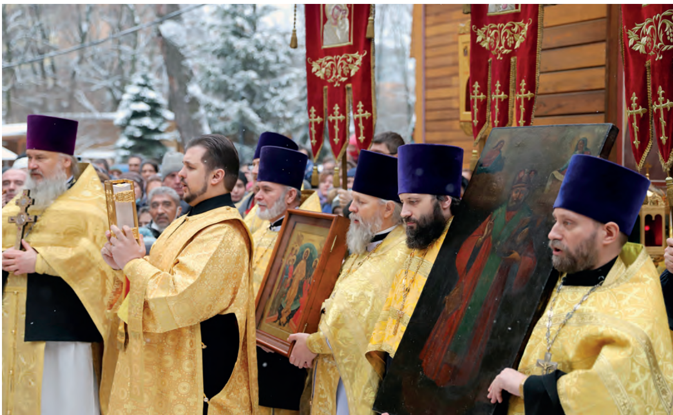
Отцы на престольном празднике