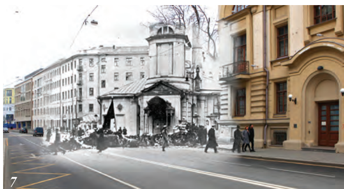
Баррикада на Остоженке (фото 7)